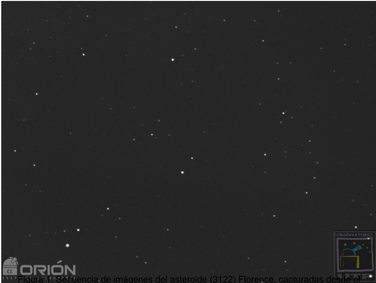
Figura 1. Secuencia de imágenes del asteroide (3122) Florence, capturadas desde el OAUTP.